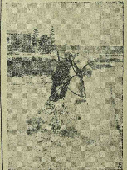
A jelentést vivő német lovaskatona számára a folyó jeges vize sem akadály