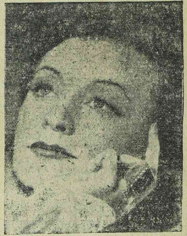
ZARAH LEANDER az UFA-filmek népszerű női főszereplője