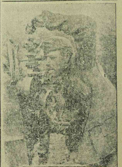
Német tűzér pontosan beállítja ágyuját

a FOTO STUDIOBAN a leggyorsabban készülnek Timisoara I., Piata Libertatii 4