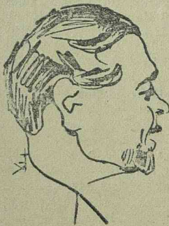
HANS BRAUNSI WETTER, a kitünő UFA filmszínész