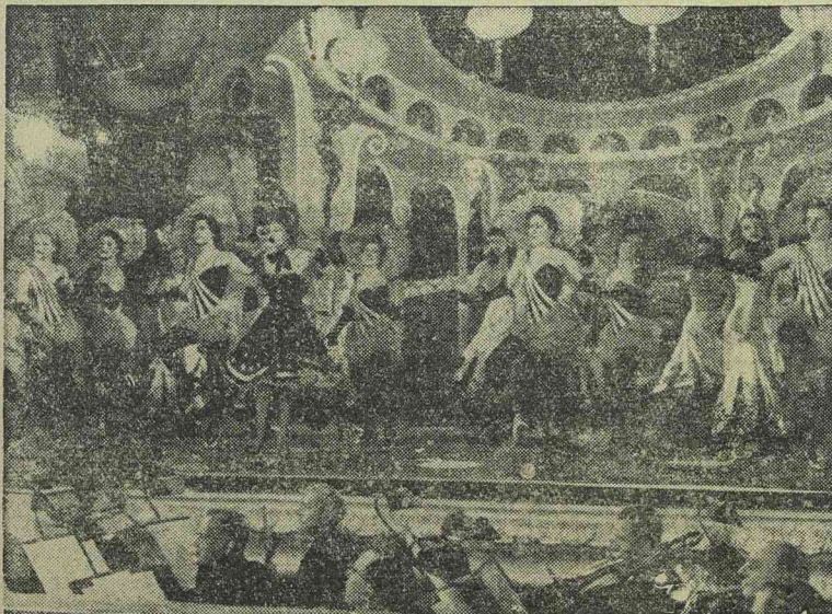
Mozgalmal jelenet a „LUNA ASSZONY” című Tobis-filmből

Karácsonyi és újévi ajándékkul egy művészi kivitelű