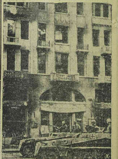
Német harcikosik Charkow utcáin

Nyomatott a tipografia „Timisoara” körforgógépén, Timisoara.