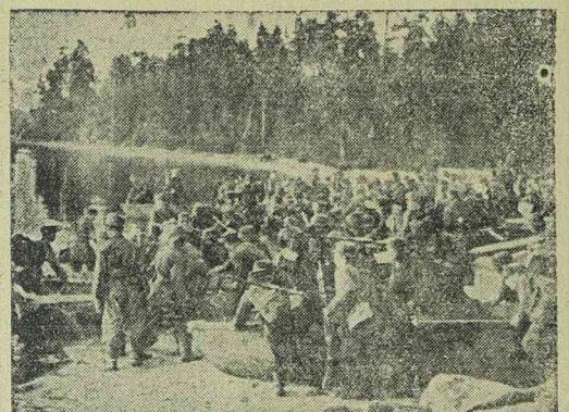
Finn katonák átkelnek egy taven