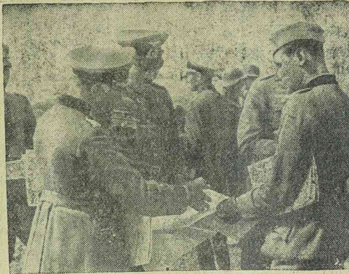
Német parancsnokok tanácskozása a keleti fronton