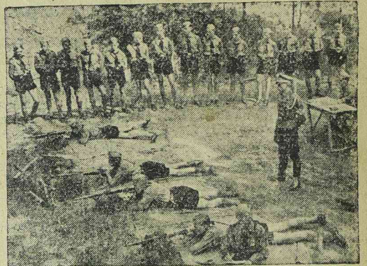
Hitler-ifjak gyakorlata egy táborban