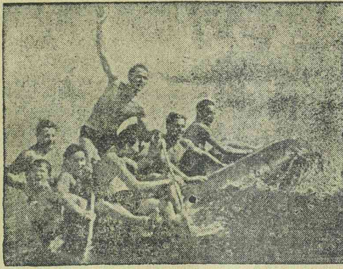
Német katonák vidám fürdőzése