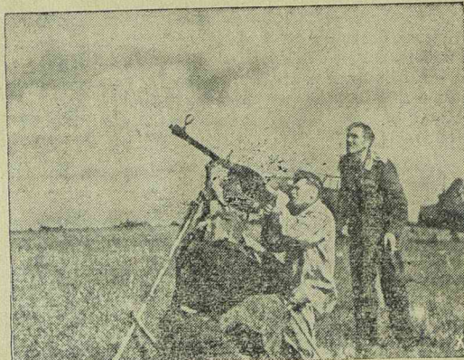
Német légharóító gépfegyver működésben a keleti fronton