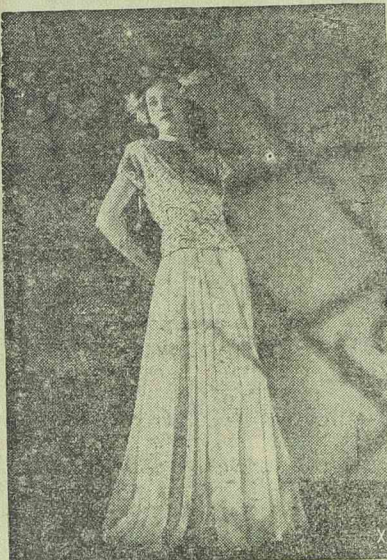
Estélyi ruha fehér georgetteből