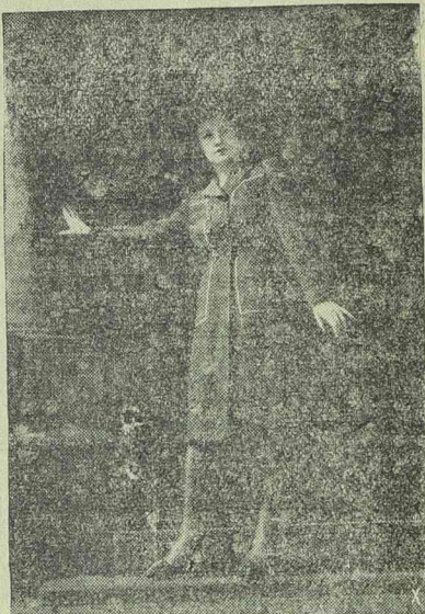
Világos rozsdabarna sportköpeny