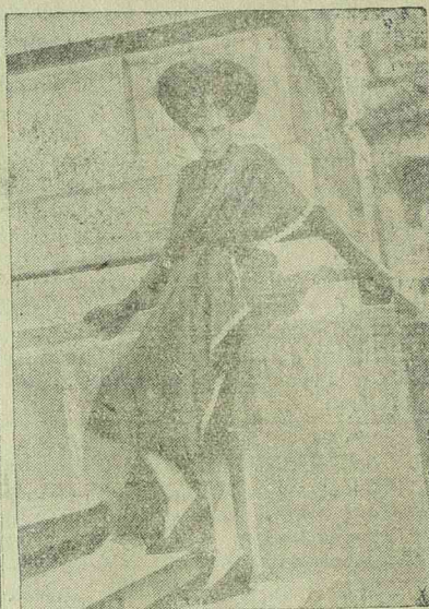
Izléses délutáni ruha sötétbarna selyemből