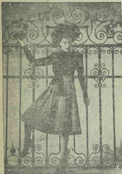
Kétszínű jerseyruha, fekete felsőrészel