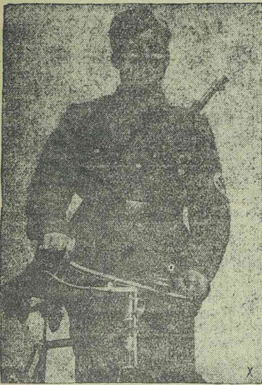
Kerékpáros német katona nevetve indul a harcba