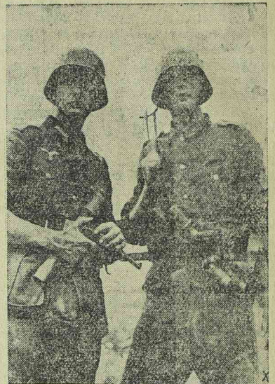
Két német gyalogos a Szovjet elleni harcban