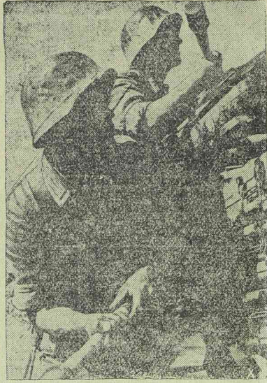
Kézigránátokkal a kézben várja a két német katona a támadásra alkalmas pillanatot