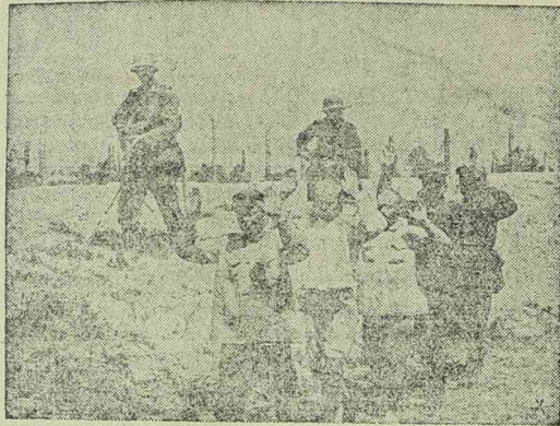
Szovjet hadifoglyokat kísérnek a fogolytáborba