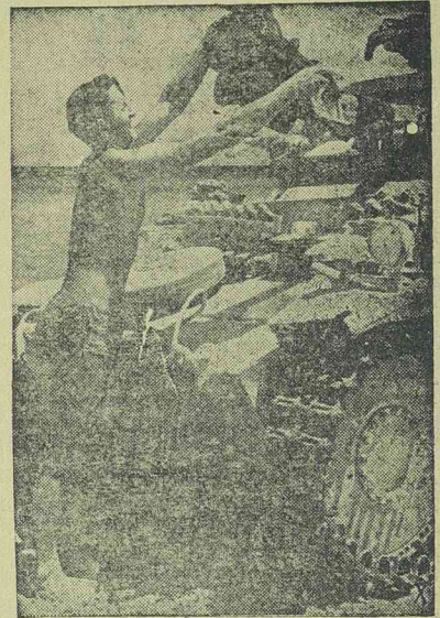
Kemény harcok után jól esik a fürdés

Teheránból jelenti a Rador: Biztos forrásból közlik az alábbiakat: A szovjet-kormány az angolokhoz hasonlóan demarsot intézett a teheráni kormányhoz az állítólag nagyszámú Iránban tartózkodó németek ügyében. A szovjet-demars kéri a teheráni kormányt, távolítsa el az ország területéről a német alattvalókat.