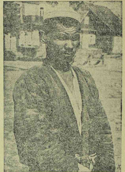
A szovjet hadsereg egyik mongol harcosa német hadifogságban.