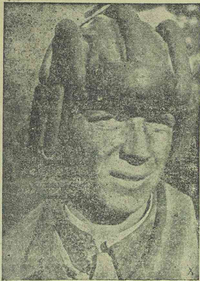
Az egyik szovjet páncélososztag német fogságba került katonája.