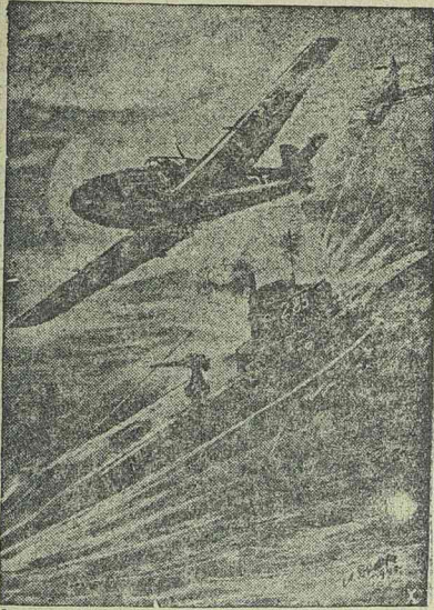
Német harci gépek támadása ellenséges búvárhajó ellen