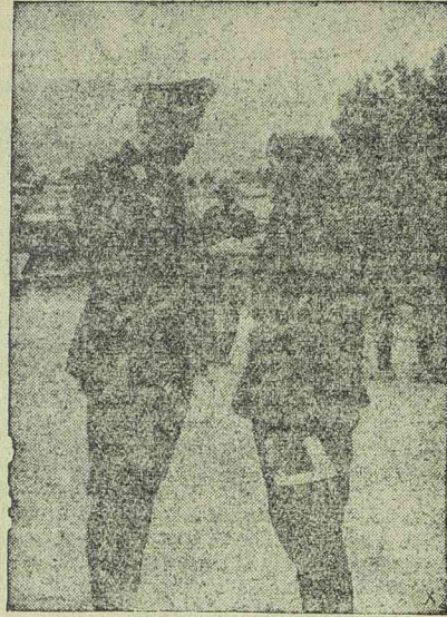
List tábornagy kitüntet