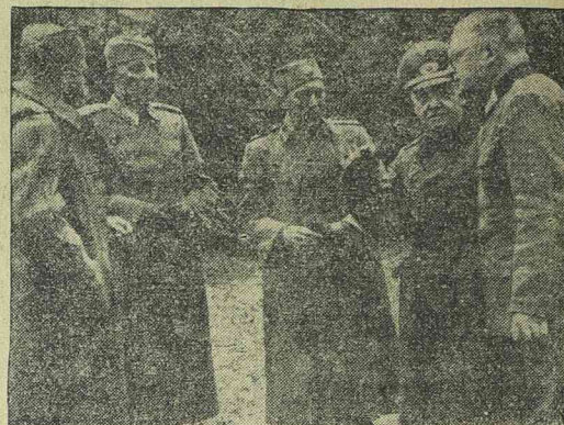
Szerb hadifogoly tisztok az egyik német délkeleti hadsereg főhadiszállásán.

Csinosan butorozott különbejáratu szoba azonnalra kiadó. Timisoara, II., Str. Moise Nicoara 8. Schneider. (2001)