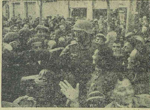
Szalonikiben a lakosság szívélyesen fogadta a bevonuló német katonaságot.