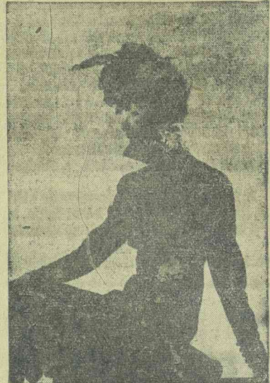
Déiutáni stilizált divatkombináció, fekete gyapjuruha, álló gallérral, amelyet aranyhimzés diszit. Az újdivatu frizurához sikkes kalap alkalmazkodik, hasonló anyagból, toldisszel.

Akiknek nem a konyhapénzből kell elspórolni,