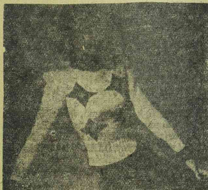
Rendkívül bájos pullover téli szezonra. Ez az eredeti bécsi modell általában nagy tetszést keltett. A fehér anyagból készült pullover piros gallérral és piros motívumokkal rendelkezik. Az ujjakon is vörös felhajtóka van.