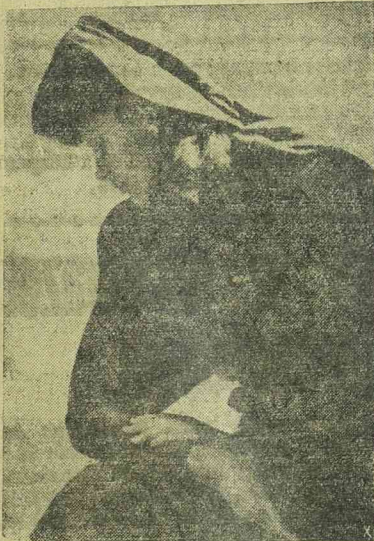
A finom és izléses köpeny kékes-zöld gyapjuszövetből készült, megfelelő kalappal. A hasonló színű gyapjúsál mintegy összekapcsolja a kalapot a köpeny nyel.