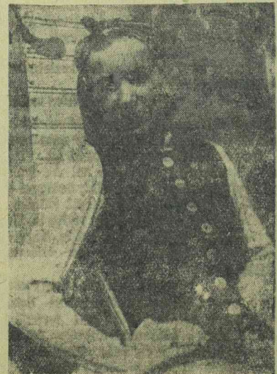
A téli divat előhírnöke ez a sportmelény piros szövétből, ezüst gombokkal és kötött ujjakkal, hátsó részzel és gallérral. Eredeti salzburgi modell.