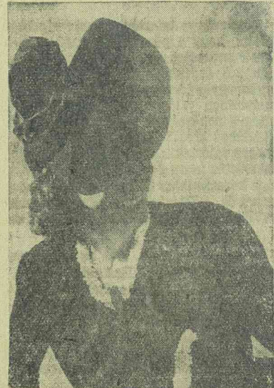
A kalapdivat is újat és finomat hoz. Mutatja ez a nagyszerű kis filz-kalap.