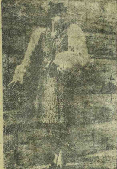
A legújabb téli divat igen előnyösen érvényesül az egyik berlini szörmeáruház ezen prémes kabátkáján. A sportszerű kabát rendkívül izléses összeállítása kétféle szörmenek.

Maga csak keveset eszik. Előnyére. Mert hát a vonalak! A férjnek is melegen ajánlja, mert hát pocakos lesz. Az ebédből még lecsip kis vacsorát a mosónőnek és megmarad a vacsorapénz. Aztán, kedves férjcském, most már nem mosnak azért, hanem százötvenért. Hustalan nap inkasszálja a hus árát. Ha a férj reklamál, akkor: mondd már, holnap pótolom, csirkét kérek. Aztán richtig beoszt egy pár verebet két napra. Ezzel is jól jár.