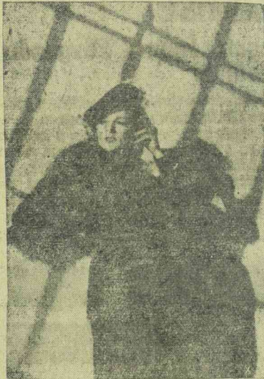
Az egyik berlini szörmeáruház nagy feltűnést keltett kreációja ez az ezüst-róka-echarpe. Hatásos a szörme feldolgozása spirális vonalban.