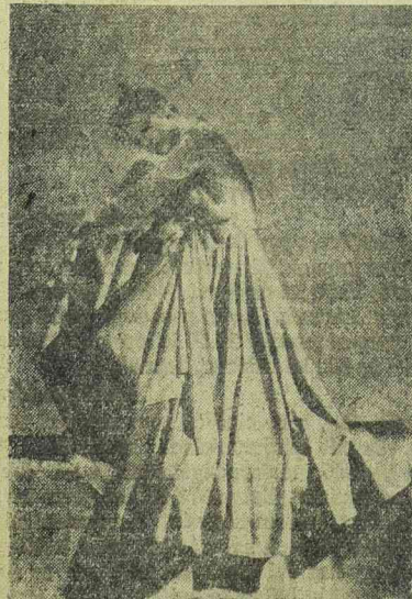
A szezon első estélyi öltözéke felette izléses és decens. Ez az estélyi ruha Shantung-selyemből készült. A ruha a zöld szín két árnyalatával bír és hatásosan érvényesül a halványzsinű dísz.