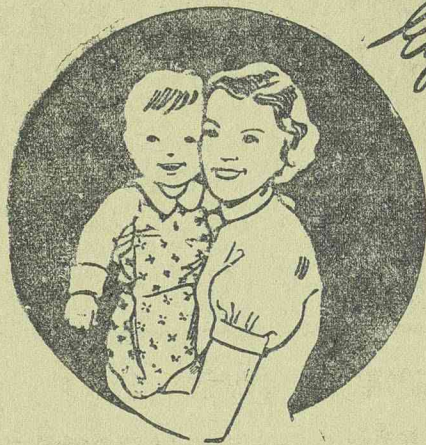
A teljes gyermekápoláshoz szükséges továbbá NIVEA-gyermekpuder és NIVEA-gyermek-krem