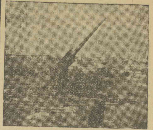
Légharító ágyú, melyet az angolok gyors menekülésük közben a nyugati határon hagytak vissza.

Gyorsan fedezékre megyünk. Laposan fekszünk itt; kemény idegpróbát állunk ki. Szakaszunk egy része felkerekedik a tüzelésben beállott rövid szünetben. Ebben a pillanatban bator páncélos vadászok gördülnek el előttünk, míg oldalt három kilométernyire jobbra az ellenfél nehéz géppuskái biztos állásokból lövöldöznek. Néhány gyalogsági löveg órákon át sakkban tartja őket. Egy gépkocsi halad át a tüzéségi tűzön. A Cote de Talu-ról jön, ahonnan vasárnap az itt harcoló ezred egyik zászlóalja négy ellenséges üteget tüzött el. A gépkocsiban a gyalogsági parancsnok áll; mögötte előjönnek az első zászlóalj részei, elérik a rohamcsapatokat és támadásra indulnak. Végre elérjük Belleville külvárost, amelyet nehezen leküzdhető drótakadályok és torlaszok mögött védenek. Az élen levő század ügyesen eloszlik. Kézigranátok és az ezred nehéz fegyverei végeznek azzal, amit tüzéségünk még nem vert szét. A Bellevillei erőd még mindig tüzel, a parancsnok azonban zászlóalja élén bevonul a külvárosba, ezzel pedig Verdunbe is. Közben az erődök végre elhallgatnak, a világháborús sirok hosszú sora mellett a fellegrvár felé vesszük utunkat. Verdun fellegrvárán 12 óra 30 perc óta a Német Birodalom lobogója leng. Lent a nagy szállodákról most lassanként eltávolítják a francia zászlókat. A város déli szélén