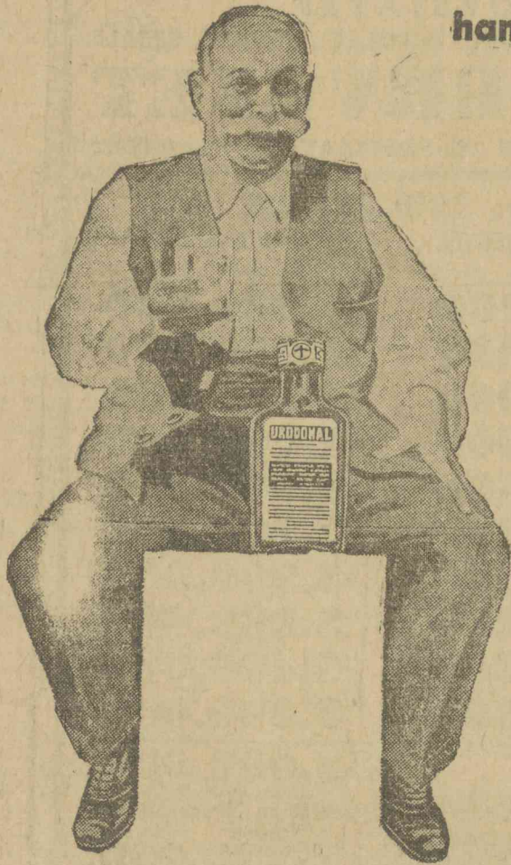
Kapható gyógyszerárakban és drogériákban

A mindennapos Urodonal kezelés méregtelenít, ujjaéleszt.