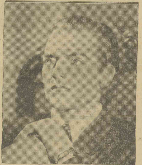
Van! Quadrilleg az UFA művésze A királynő szíve című új filmben kapott nagy szerepet.

ígéri, hogy igenis engedetlen lesz, meg fogja máskor is tenni. Remeg. Szembenéz a büntetéssel. Megkapja a büntetést. Sirva fakad. Elszalad.