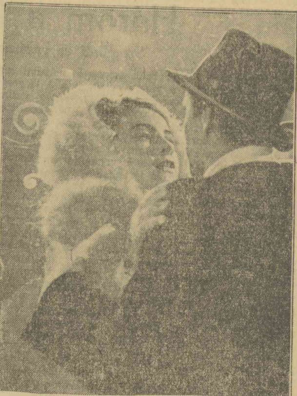
Scenériumi jelenet az Ufa Bal paré című filmjéből, melynek főszereplői: Ilse Werner és Hannes Stelzer.

APOLLO: Asszonyok szállodája (angol film) CAPITOL: Utazás Tilsit-be (német film) SCALA: Táne a föld körül (angol film). CORSO: Az élet komédiája (angol film).