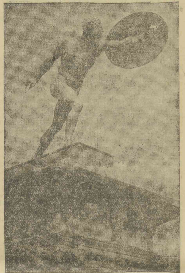
Részlet a berlini Frigyes császári múzeum régiségosztályából

Győzött a román rugby válogatott. Románia rugby válogatottja vasárnap Bucarestiben mérte össze erejét az olasz válogatottal és azt 3:0 arányban legyőzte.