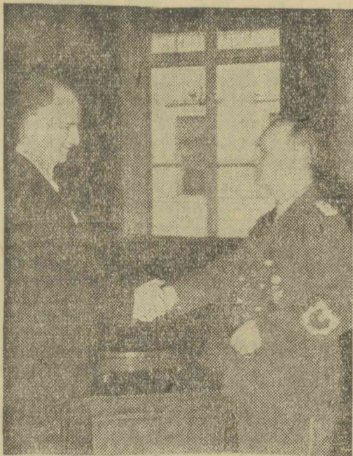
Welles amerikai államtitkár Berlinből Londonba való elutazása előtt szívélyesen búcsúzik Ribbentrop német külügyminisztertől.

A Times római tudósítója azt jelenti, hogy titeltérdemlő forrásból származó értesülése szerint megtudta, mi történt a pápa és a német külügyminiszter találkozásánál.