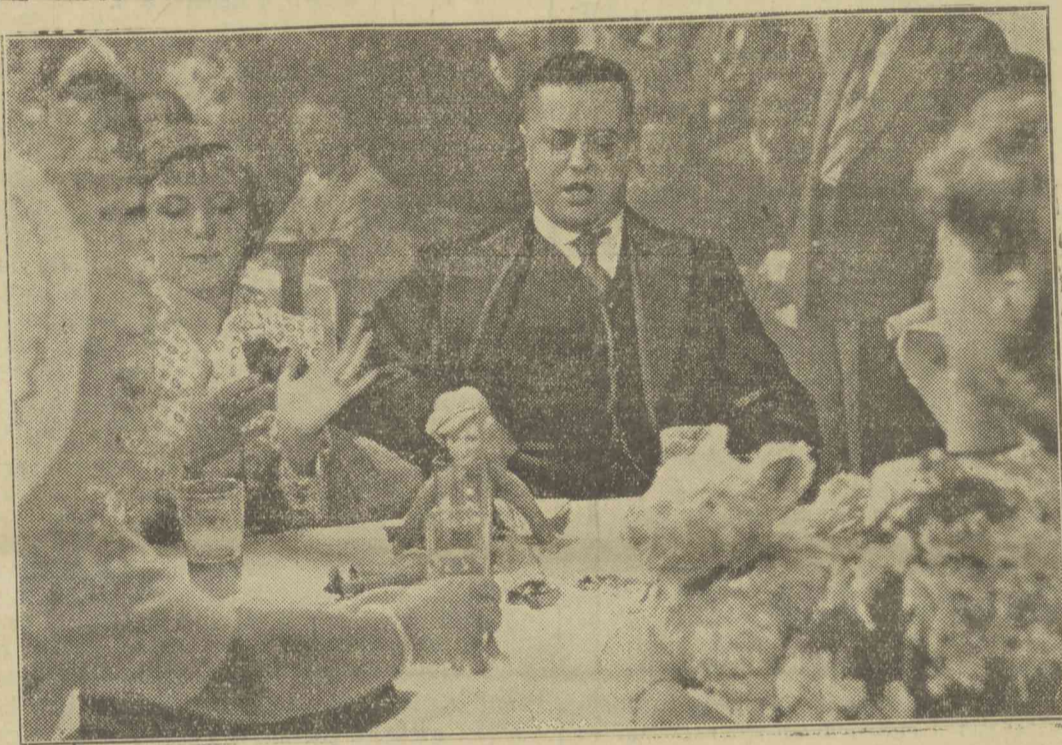
Jelszó: Machin, az UFA egyik legújabb és legsikerültebb filmje. Ennek a darabnak egyik jelenetét mutatjuk be

mert a holland védekezési rendszerhez hasonló terveket készítettek, amelyek szerint a határ mentét mesterséges árvízzel zárhatják el az orosz hadsereg elől. (Rador.)