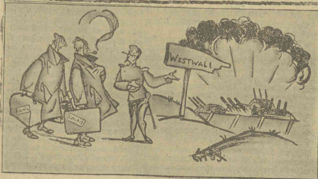
A NYUGATI FRONT HUMORA: