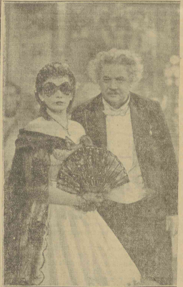
Zarah Leander és Stezak Leó

a „Mámoros bálészaka volt...” című UFA-filmben. Játékvezető: Karl Frölich