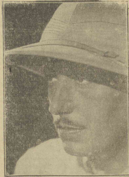
Willy Birgel a Kongo-expressz c. UFA-film főszerepében