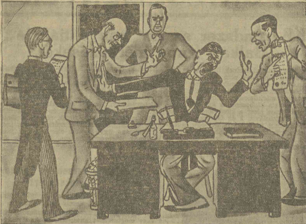
A háboru numora. Chamberlain a semlegeseknek: — Ne utakozzanak! Nincs semmi értelme. Miért legyen Önöknek jobb dolguk, mint nekünk?