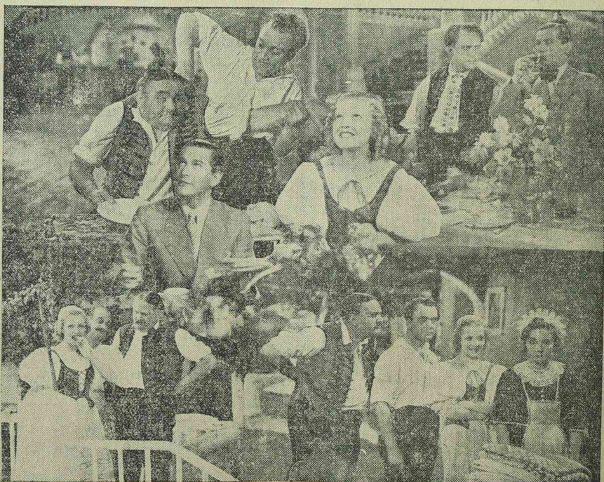
Pacsirta - Lehár világhírű operettje csütörtöktől a SCALA-ban