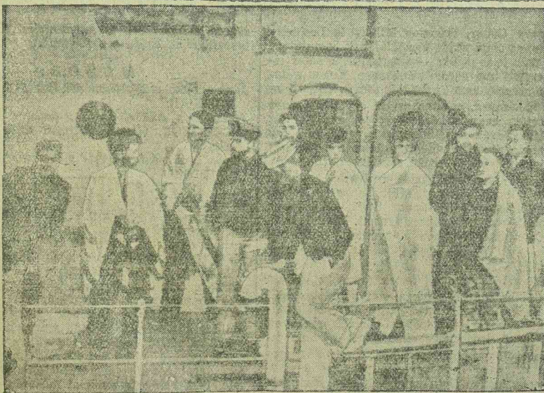
Menekülés a halál torkából