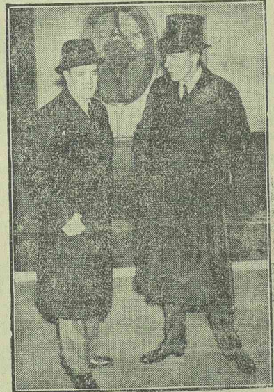
Gafencu külügyminiszter (bal) beszélget Londonban Halifax angol külügyminiszterrel

A Domei ügynökség jelentése szerint Arita japán külügyminiszter ma megtárgyalta a német és az olasz nagykövetekkel az európai feszültség kérdését. A megbeszélés előtt a külügyminiszter a mikádónak tett részletes jelentést az európai helyzetéről.