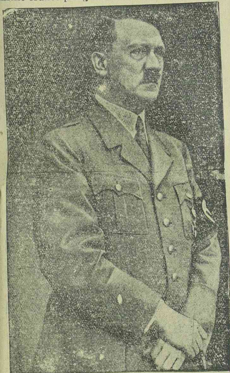
Hitler legújabb képe

Prágából jelentik: Hitler 50-ik születésnapját Prágában is nagy parádával ünnepelték meg. Az ünnepségeken résztvettek a prágai katonai helyőrségek és többek között jelen voltak Sirovy és Fiala tábornokok is.