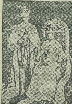
Öfelsége, VI. György király, az angol világbriodalom uralkodója és Erzsébet királyné

— írja a lap. Az egész utvonalon mentén sürrü tömegek adták tanujelét őszinte megelégedésüknek