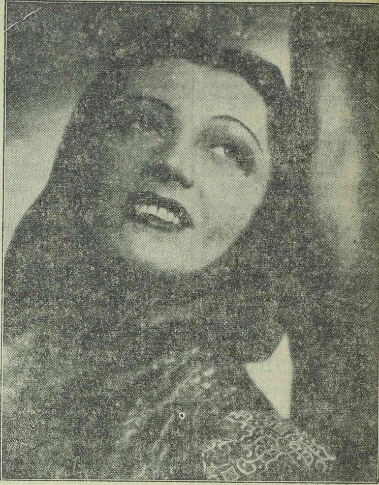
POLA NEGRI a Scala legközelebbi slágerfilmjének, melynek címe A szent hazugság főszerepét játssza