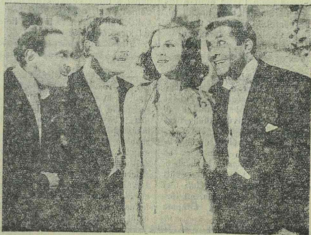
Csodák csodája című slágerfilm egyik jelenete a Ritz-testvérekkel