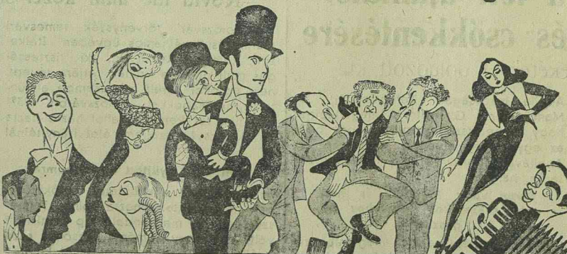
Ma, szerdán utoljára: „LA HABANERA” Zaraf Leander