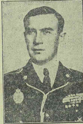
SIDOROVICI, az Országőr-szervezet parancsnoka

Sidorovici Teofil megállapította, hogy amikor az iskolákban a csütörtöki napot az országőr-mozgalomnak szentelték, egyszerű nevelési eszközt biztosítottak az ifjúság számára. Ezen a napon ugyanis az ifjúságnak alkalma nyílik arra, hogy gyakorlatilag értékesítse mindazt, amit a hét többi napján az iskolában tanult anélkül, hogy az ifjakat elszakítanák a családi körtől. Ez a rendszer azonban csak akkor termelhet ki valóban értékes eredményeket, ha az országőr-intézmény vezetői az ifjúság iskolai irányítói és maga az ifjúság között létrejön a szükséges együttműködés. Eppen ezért Sidorovici Teofil parancsnok a mozgalom jelentőségének kifejezése mellett arra kérte az összes érdekeltet, hogy a munka eredménye érdekében fogjanak össze és minden erőforrásukat becsásák a közös cél rendelkezésére.