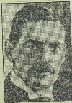
CHAMBERLAIN angol miniszterelnök

tegnap délelőtt kilenc óra és harmincöt perckor elhagyta Berchtesgaden,