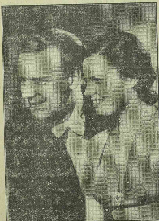
Vendégszereplés a paradicsomban című UFA-film két főszereplője: Matterstock Albert és Krahl Hilde

— EDDIG DÖNTETLEN AZ OLASZ-MAGYAR TENNISZ-KK. Budapesten a Margitszigeti pályán tegnap kezdődtek meg a magyar-olasz tennismérkőzések. Canapelle olasz legyőzte a magyar Dalost 8:4, 4:6, 6:1, 6:0 arányban, a magyar Gábori pedig az olasz Vidot 6:0, 6:3 arányban.