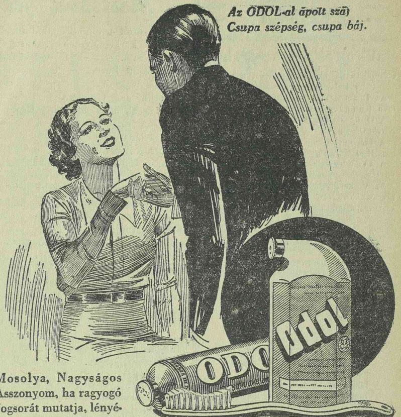
Az ODOL-al ápolt szá Csupa szépség, csupa báj.

A spanyol hadszínterről a nemzetiek sorozatos győzelmeket jelentenek. A nemzeti repülőek tegnap ismét Valencia kikötőjét bombázták. A bombák súlyosan megsebesítették a