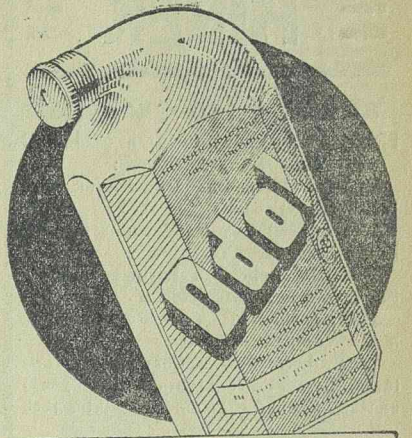
Felülmulhatatlan az ODOL fertőtlenítő és tisztító ereje. Ude leheletét tökéletesen biztosítja az ODOL.

Hangoztatta, hogy a magyaroknak egy táborban kell tömörülniök. Szül-