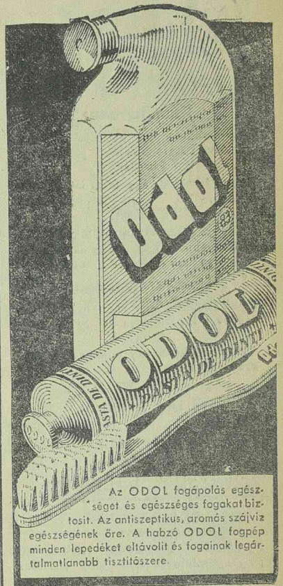
Az ODOL fogápolás egészségét és egészséges fogakat biztosít. Az antiszeptikus, aromás szájvíz egészségének ére. A habzó ODOL fogpép minden lepedéket eltávolít és fogainak legértelmesebb tisztítószere.

szerint erre a célra a legmegfelelőbb Godzsam tartomány volna, amelyet a Nilus egészen a Tana-tóig jóformán teljesen elzár Abesszinia többi részétől. Ennek fejében a négyes lemondana címéről és beletenyugodna a jelenlegi helyzetbe. Lugard lord szerint ez a megoldás Mussolini részéről valóban római gesztus volna és megerősítené a barátságot Olaszország és Anglia