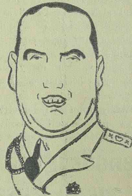
CIANO Olaszország külügyminisztere

A Csehszlovákiával szemben növe- kedő veszély — írja tovább a lap — megnövelte a Németország által adott biztosítékokat is, de ezeknek értéke nem tultanyag. Litvinov nyilatkozata