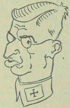
SCHUSCHNIGG tegnap este nagy beszédet mondott.

— Robbanás egy állomáson. A mexikói Meguarua bányatelep vasuti állomásán ismeretlen okból felrobbant több szénsávvál teli vasuti tankkocsi. A robbanás következtében két láda dinamit is felrobbant. Az óriási erejű robbanás hatvan házaat döntött romba. Tűz keletkezett, amely szintén nagy károkat okozott. Három ember meghalt, tizennyolc súlyosan megsebesült.