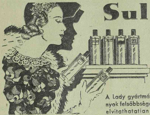
A Lady gyártmányok felsőbbsege elvitathatatlan!

Valóban nehéz választani ennyi tökéletes készítmény közül... Mon Secret, Chat Noir, Jockey Club? Nem fontos! Mindannyi, de valóban abszolút minden Lady gyártmány kiváló.