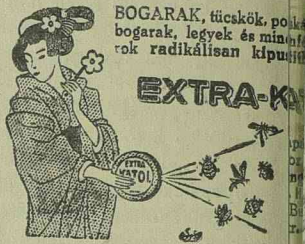
BOGARAK, tücskök, pol- bogarak, legyek és min- rek radikálisan kipu- sztatják a természetet

amely új irányvonalat jelöl ki számá- ra. A zsidó vallású magyarok pedig újra és ismét hallhatták, hogy ott akarják tudni őket, ahová kulturá- juk, anyanyelvük, hagyományaik és áldozataik szerint tartozónak érzik magukat. Az ifjúság most is megtette kötelességét. Irányt mutatott az er- délyi magyarságnak, szerves egység- be tömörítette azokat, akiket eddig csak az anyanyelv szentsége egyesít- tett. Az ifjúság megmutatta, hogy nincs olyan akadály, amelyet kellő akarással le ne lehetne küzdeni.