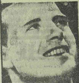
Növelje mosolyának vonzását Kolynos által.

Jegyezze meg jól: Kolynos kétszer annyi ideig tart, mint a közönséges fogkrém, mert csak felannyit használunk el belőle. Kolynos annyira koncentrált, hogy egyetlen centiméternyi is elegendő a száraz kefére kenve. Még ma... tegyen kísérletet Kolynos-szal.