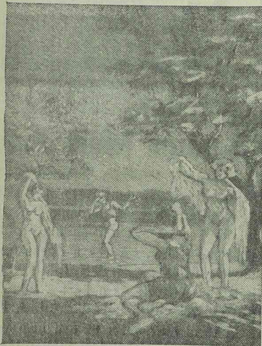
Ma este tíz óráig tekinthető meg a városi kulturpalotában (volt Ferdinandszálló - Select-mozgó helyiségében). Belpép díjtalan.