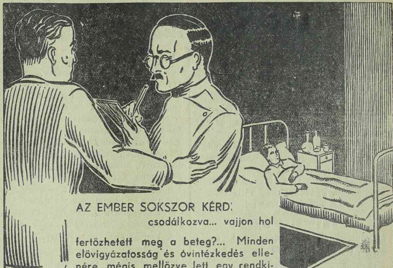
AZ EMBER SOKSZOR KÉRDŐCSODÁLKOZVA... vajjon hol

A kínai-japán konfliktus hullámai Szovjetországra nézve is lázba hozták. Moszkvában és az ország más városaiban nagy tüntetések voltak Japán ellen. Követelték, hogy Szovjetországra siessen Kína segítségére és ne engedje, hogy Japán megszállja Északkinát. A szibériai vasutonalakon állandóan folynak a csapatmozgások Kína felé. Polgári személyeknek csütörtök reggel óta csak külön engedéllyel lehet a szibériai vasuton utazni.