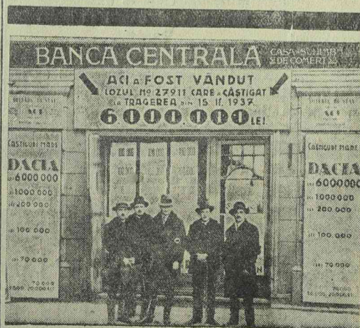
Negyed sorsjegy ára 200 lei.

Napsütés és borulás. Csütörtök napsütés váltakozott borulással. A szél alábbhagyott. A hőmérséklet az előnapoz viszonyítva csökkent. Dél előtt órák a hőmérő három fok melegeg mutatott, délután négy órák tíz, este órák pedig nyolc fok meleg volt. Várható időjárás a legközelebbi huszonné órára: csendesebb idő, változó felhőz helyenkint zápor. Éjjeli fagy, a nappfelmelegedés nem változik.