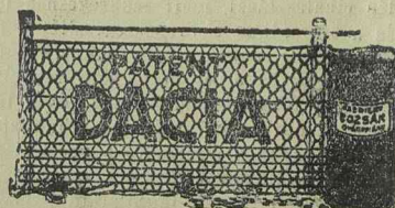
Fióküzlet: Principele Carol, Bul. Berthelot 31 (Bejárát Str. Văcărescu lánca)